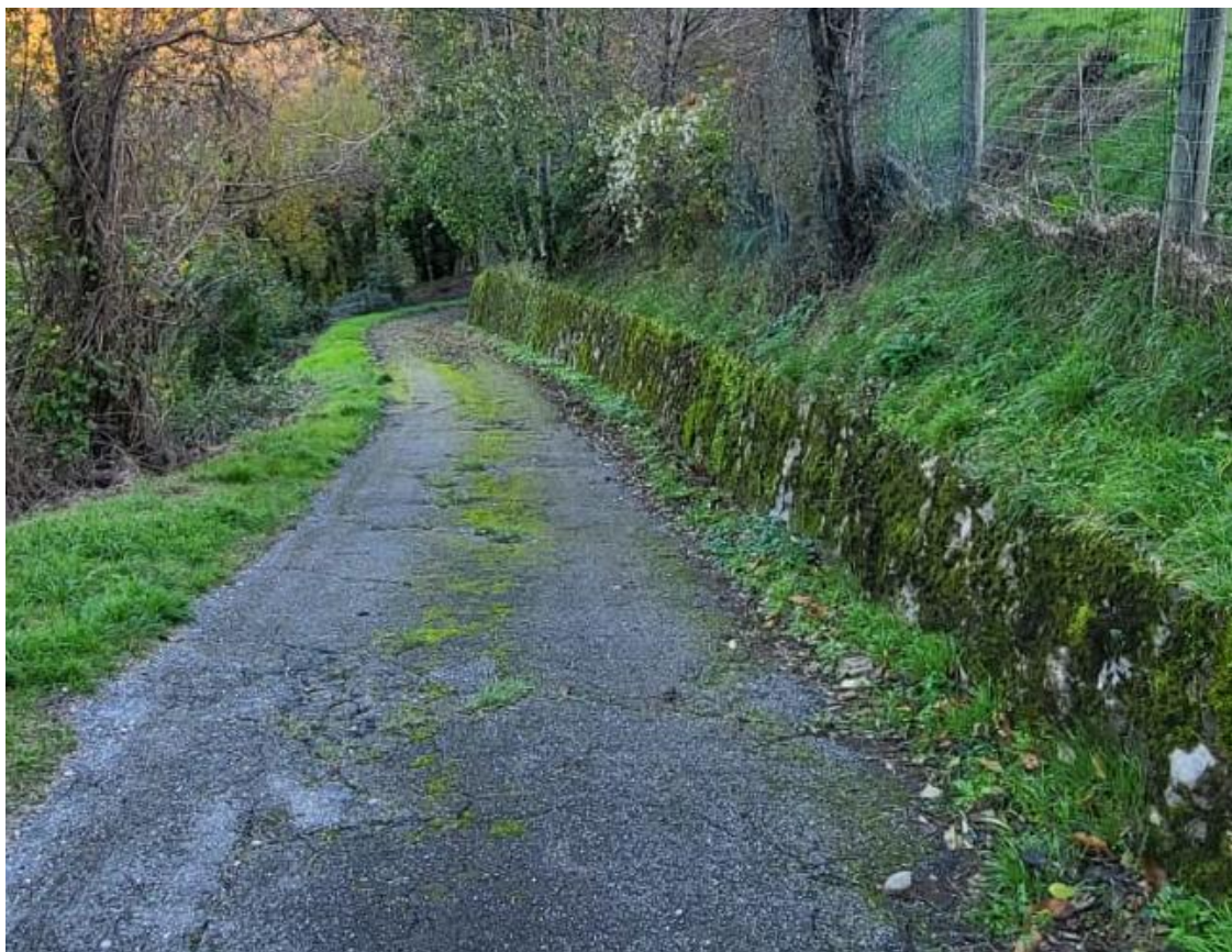
Strada di accesso al laghetto