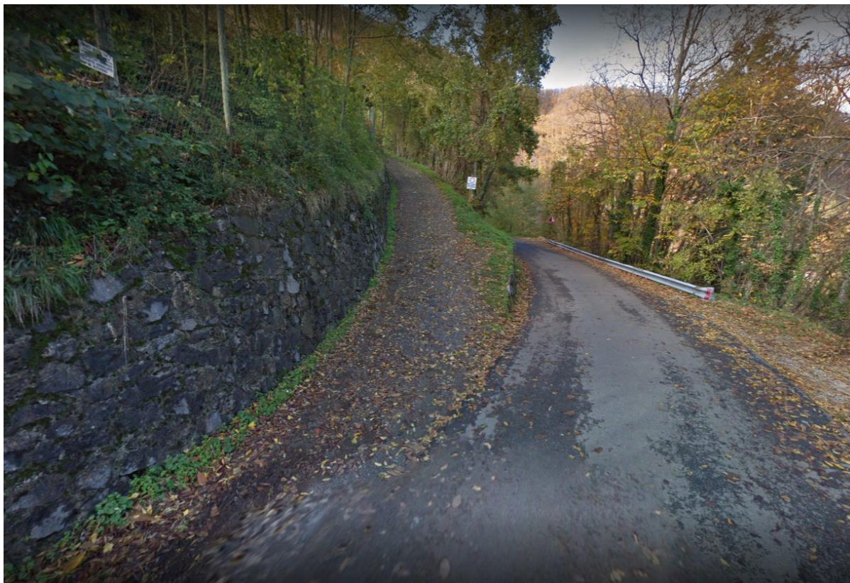
Vista zona di inserimento idrante