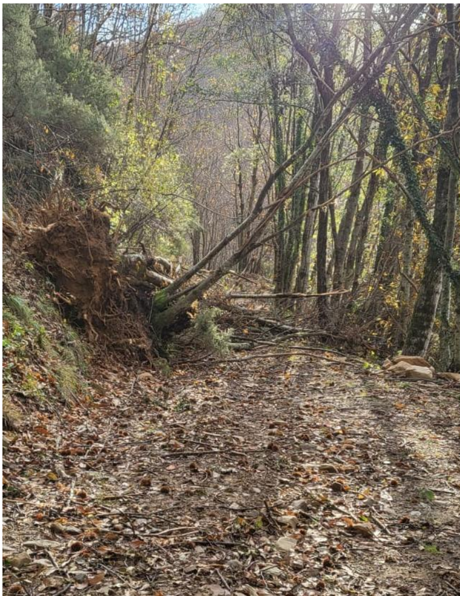
Viabilità forestale da ripristinare