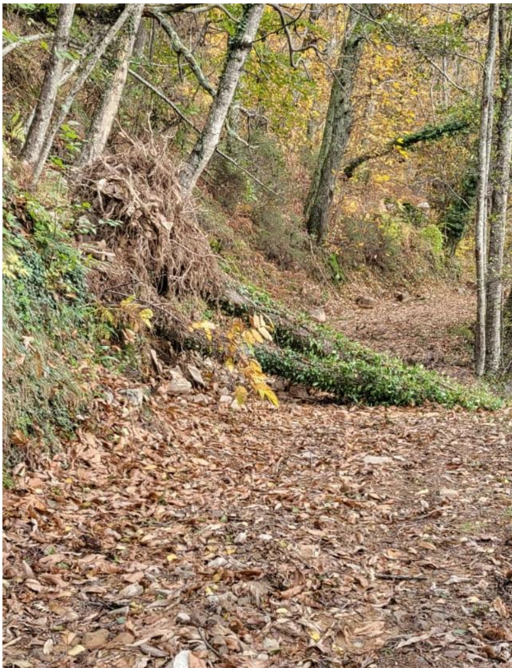
Viabilità forestale da ripristinare