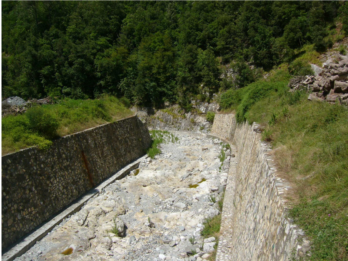
Foto 9 Vista ravvicinata alveo fluviale