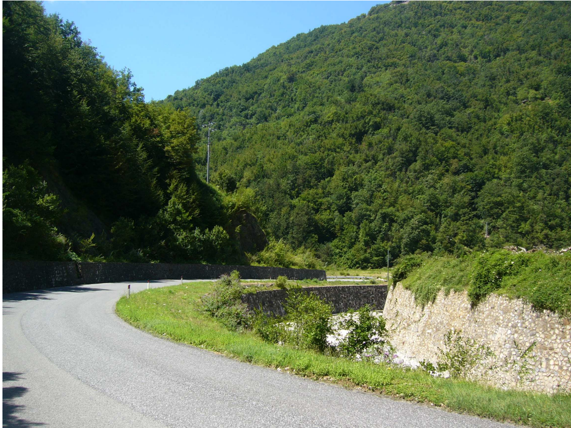
Foto 5 Vista del Torrente Cardoso verso valle