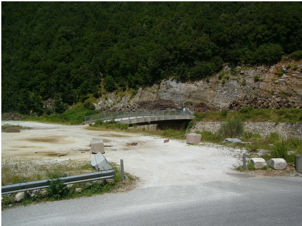
Foto 8 Vista ingresso da Via Comunale per Cardoso